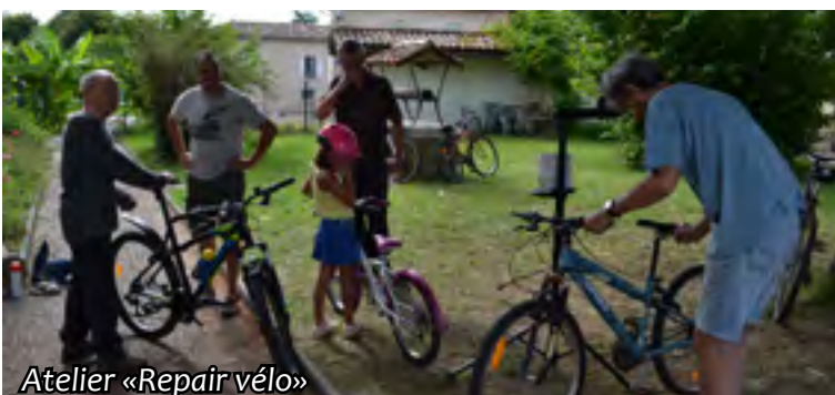
Atelier «Repair vélo»

Savez-vous que les feuilles mortes valent de l'or ? De l'or brun ! C'est la bonne période pour ramasser les feuilles d'automne et tapisser vos carrés potagers en préparation de la saison prochaine. Elles sont aussi excellentes pour nourrir votre compost. A noter que faire un feu à base d'herbe de tonte ou de feuilles mortes est strictement interdit. Selon l'ADEME, brûler 50 kg de végétaux émet autant de particules fines que 13 000 km parcourus par une voiture diesel récente.