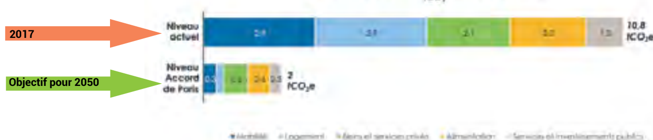
Empreinte carbone moyenne d'un Français (tCO 2 e)