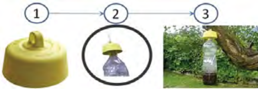
Systeme "Tap trap"

adsa33.over-blog.com adsa33.gironde@gmail.com