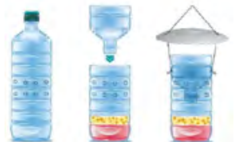
Systeme bouteille classique