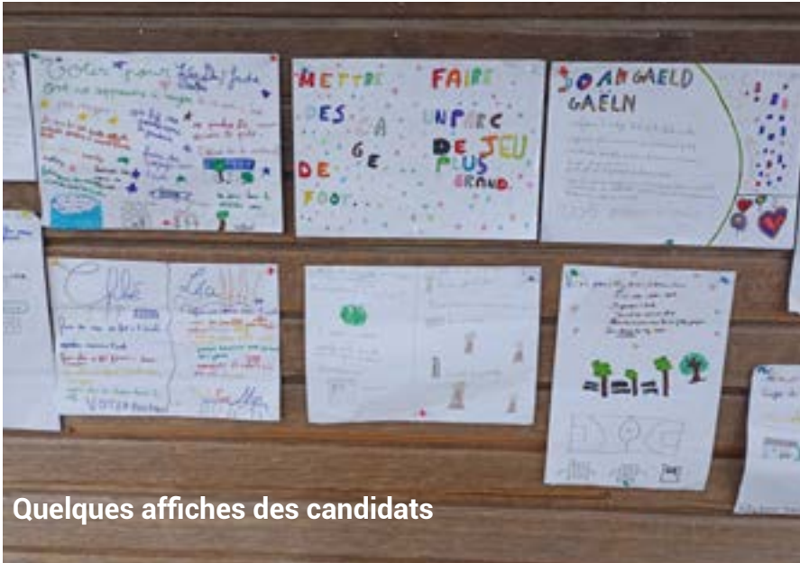
Quelques affiches des candidats

Le Conseil Municipal des Enfants est placé sous l'autorité du Maire et de l'Adjointe chargée des Affaires Scolaires. Les réunions sont coordonnées par les agents municipaux lors de la pause méridienne (12h-12h30). Ces réunions auront pour but d'échanger et de travailler sur les différents projets. Elles seront planifiées en fonction des besoins et avancées du Conseil Municipal des Enfants.