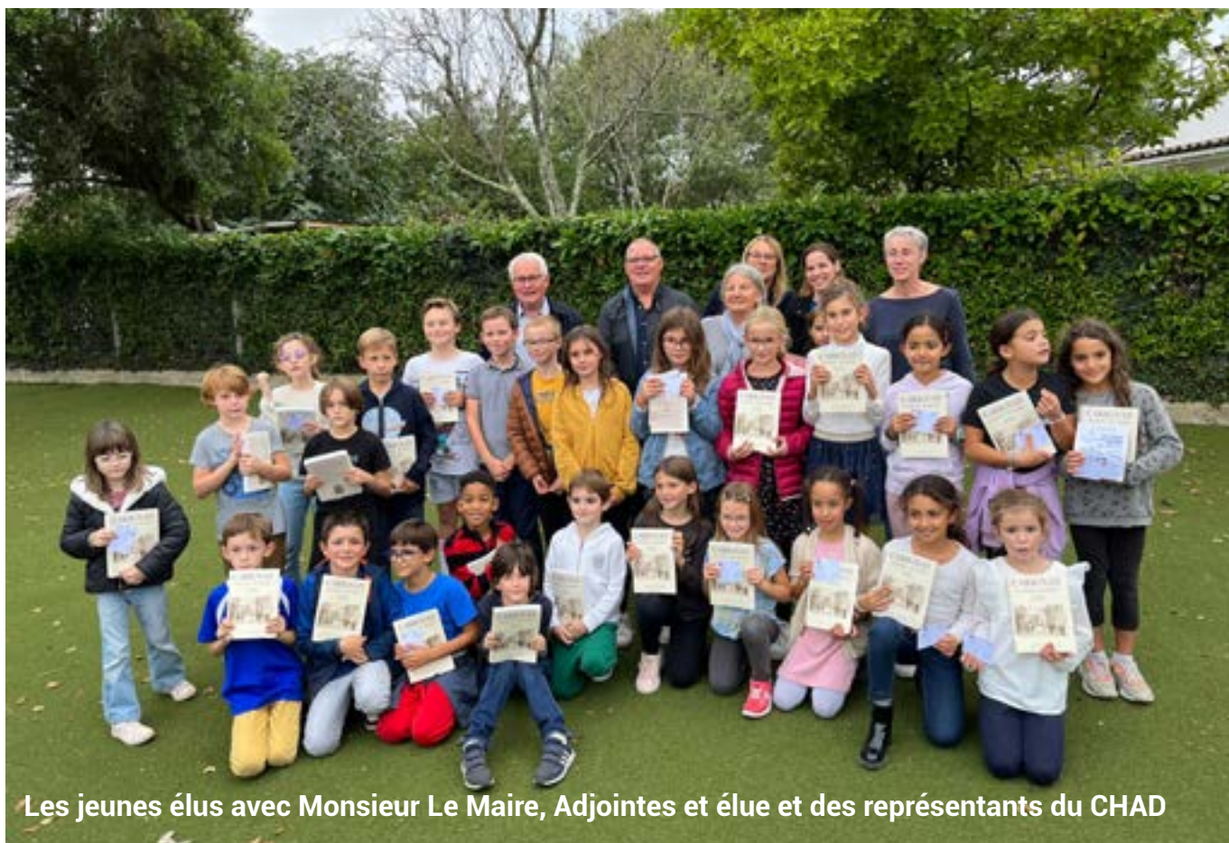
Les jeunes élus avec Monsieur Le Maire, Adjointes et élue et des représentants du CHAD

Félicitations aux jeunes élus et bravo à tous les candidats pour leur participation et enthousiasme.