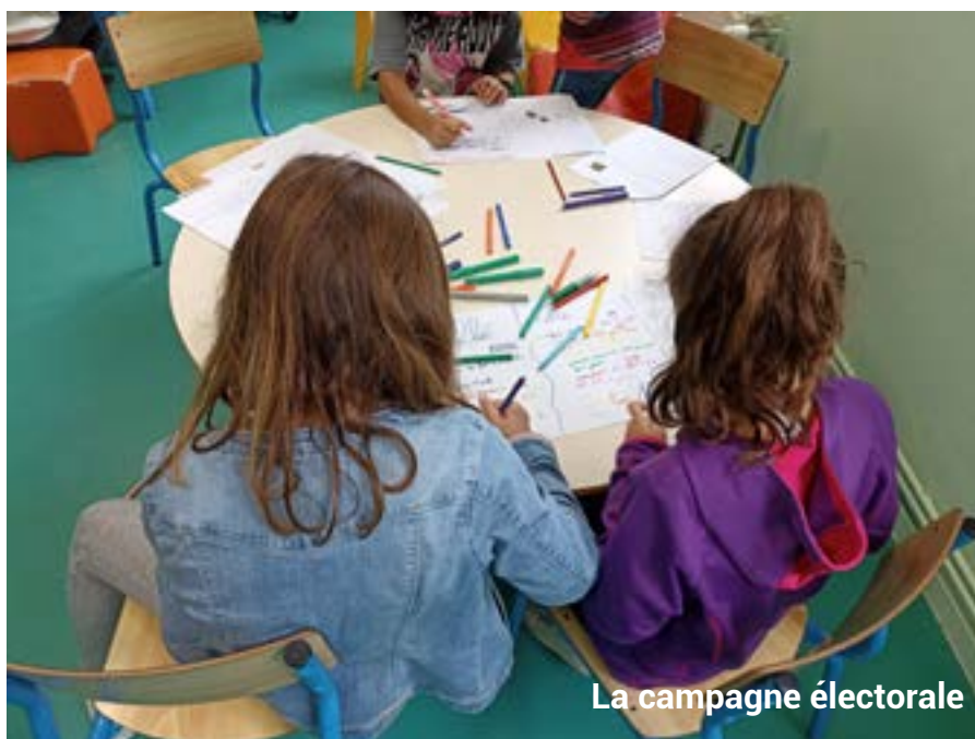
La campagne électorale

Le CME permet aux jeunes élus de partager leurs idées et celles de ceux qu'ils représentent. Ils sont consultés et peuvent émettre des