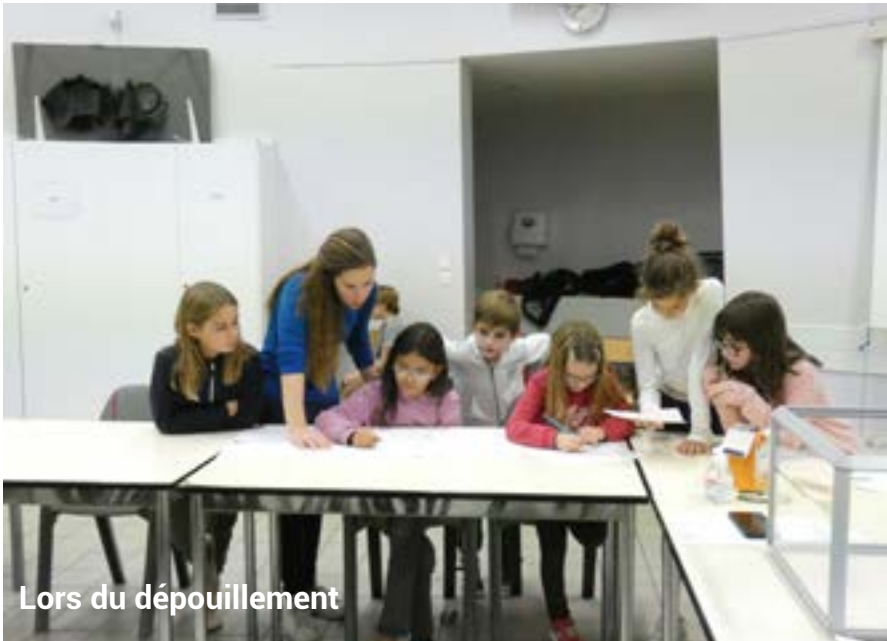
Lors du dépouillement

Les enfants des CE2 et CM1 ont eu 3 jours pour se porter candidats et apporter soit à la mairie soit au bureau des Affaires Scolaires leur document présentant leurs projets.